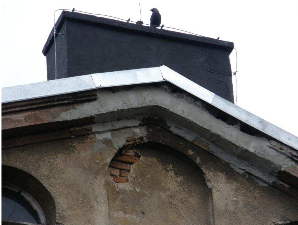
Zdjęcie nr 13 – komin i fragment elewacji szczytowej, dachu i obróbki blacharskiej