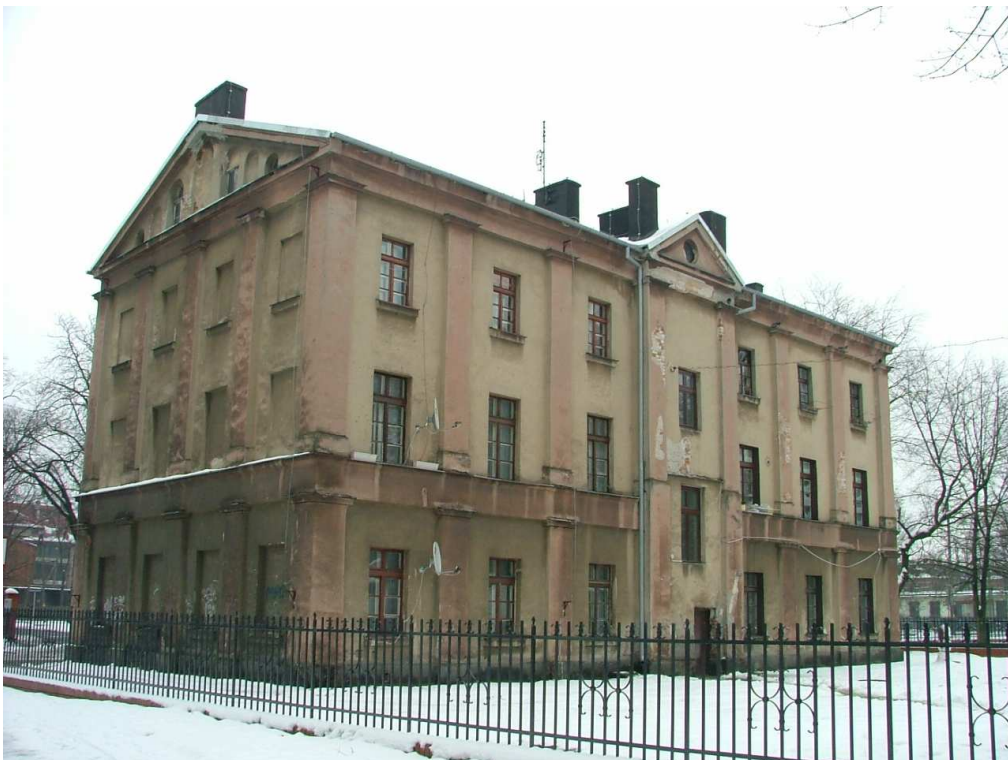
Zdjęcie nr 2 – elewacja od strony podwórka