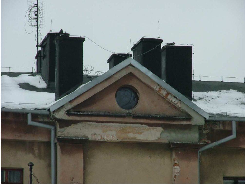
Zdjęcie nr 7 – fragment dachu, element nad klatką schodową