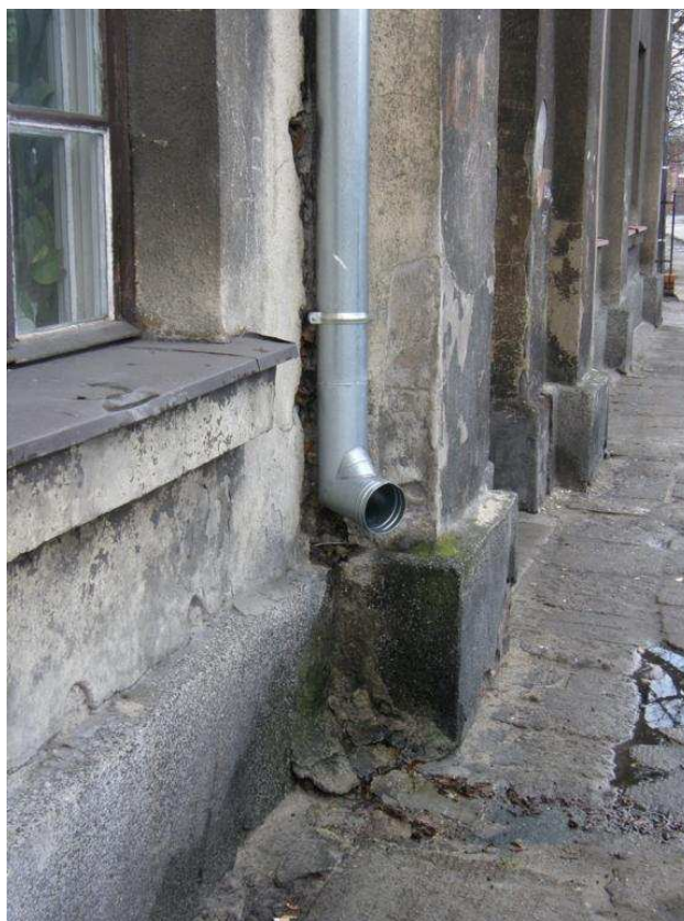
Zdjęcie nr 12 – rura spustowa i cokół