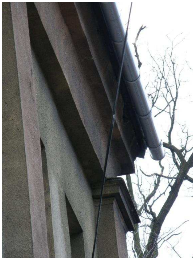
Zdjęcie nr 9 – element gzymsu, narożnik budynku