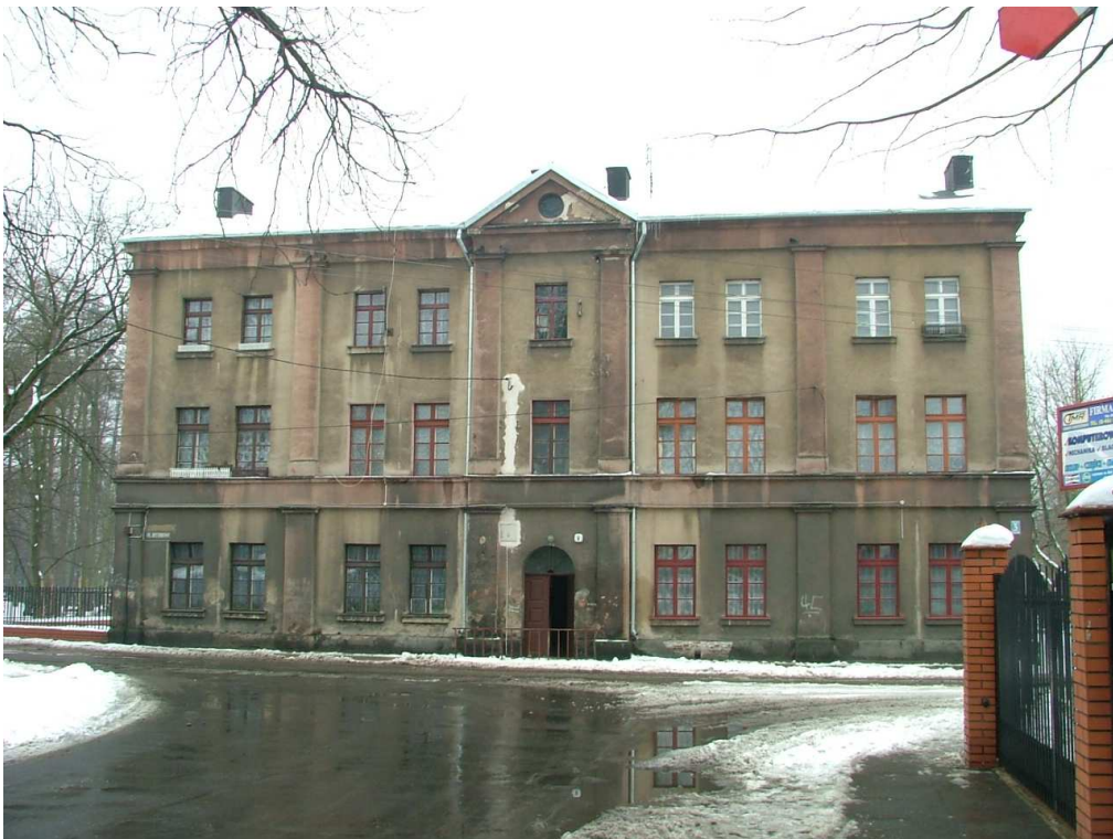
Zdjęcie nr 1 – elewacja frontowa od ul. Dittricha