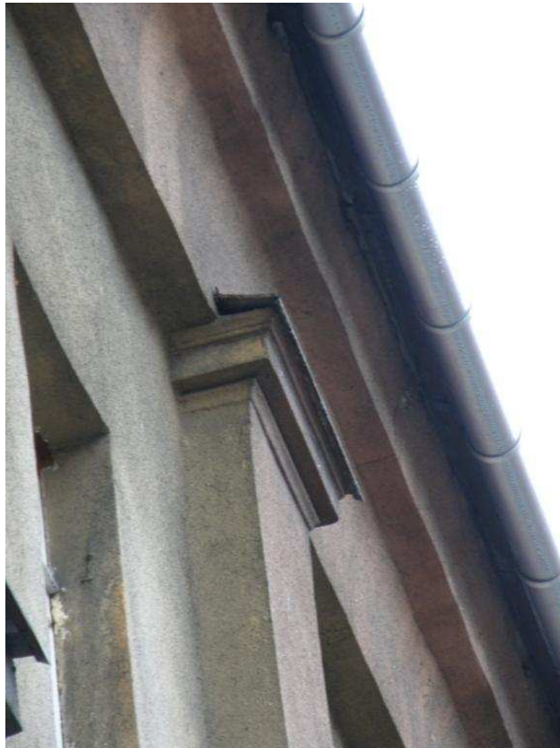
Zdjęcie nr 8 – element gzymsu, rynna