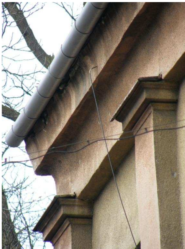
Zdjęcie nr 17 – zdobienia elewacji, fragment gzymsu, kolumny i orynnowanie