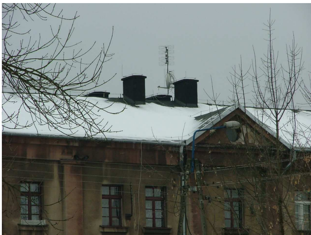
Zdjęcie nr 18 – fragment elewacji i dachu, widok od strony podwórka