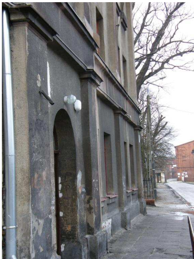
Zdjęcie nr 10 – wejście do budynku