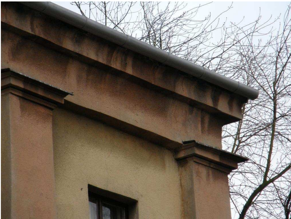
Zdjęcie nr 16 – zdobienia elewacji, fragment gzymsu