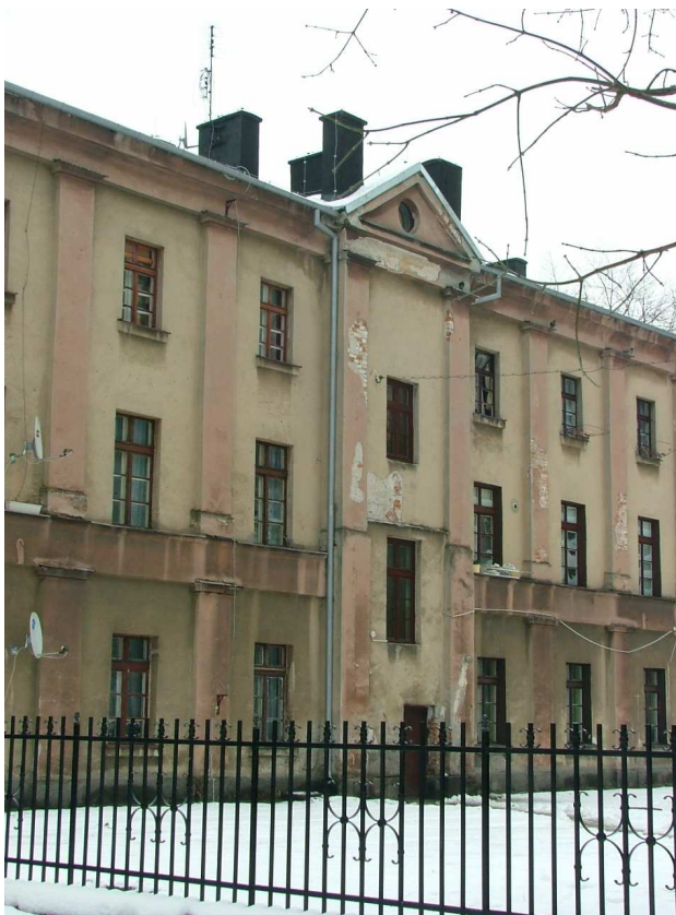
Zdjęcie nr 6 – fragment elewacji od strony podwórka, wejście do budynku