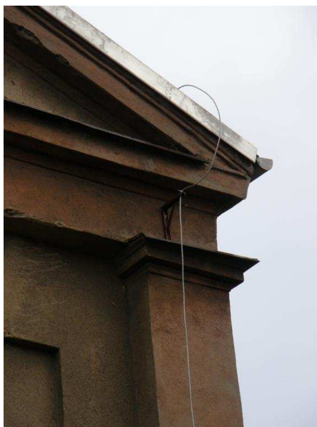
Zdjęcie nr 14 – obróbka blacharska i gzyms