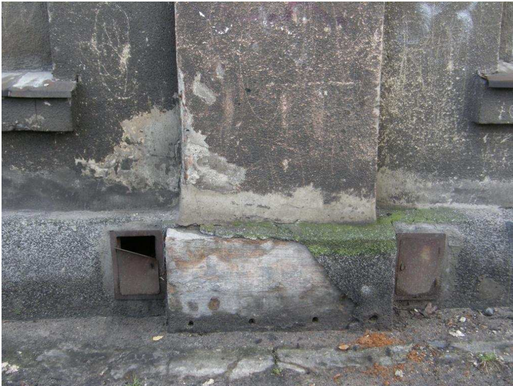
Zdjęcie nr 15 – zniszczenia cokołu