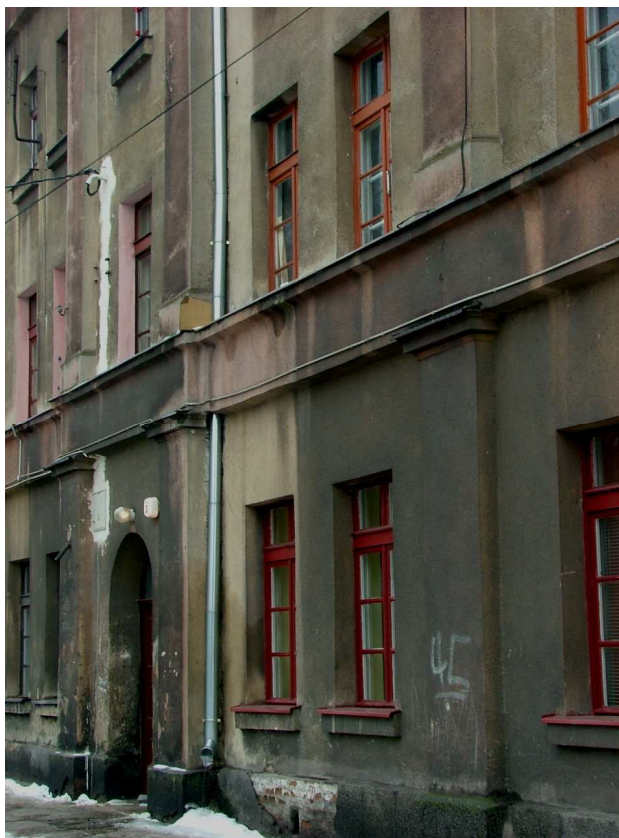
Zdjęcie nr 5 – fragment elewacji frontowej, wejście główne do budynku