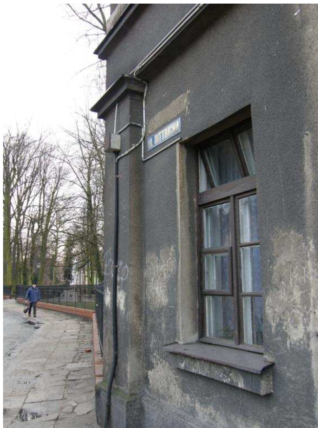
Zdjęcie nr 11 – drewniana stolarka okienna w poziomie parteru